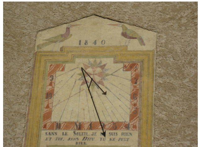
Un des nombreux cadrans solaires de Saint Véran avec la réflexion suivante adressée à la personne qui vient lire l'heure. « Sans le soleil je ne suis rien et toi sans Dieu tu ne peux rien. »