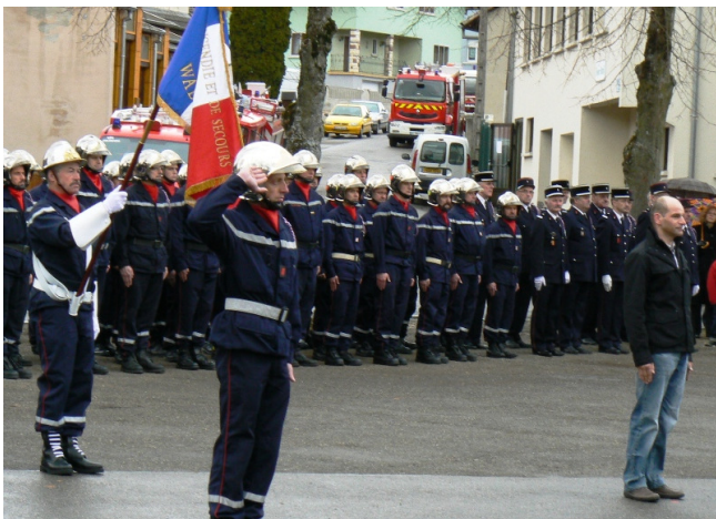
Un hommage a également été rendu aux victimes de guerre devant le Monument aux Morts