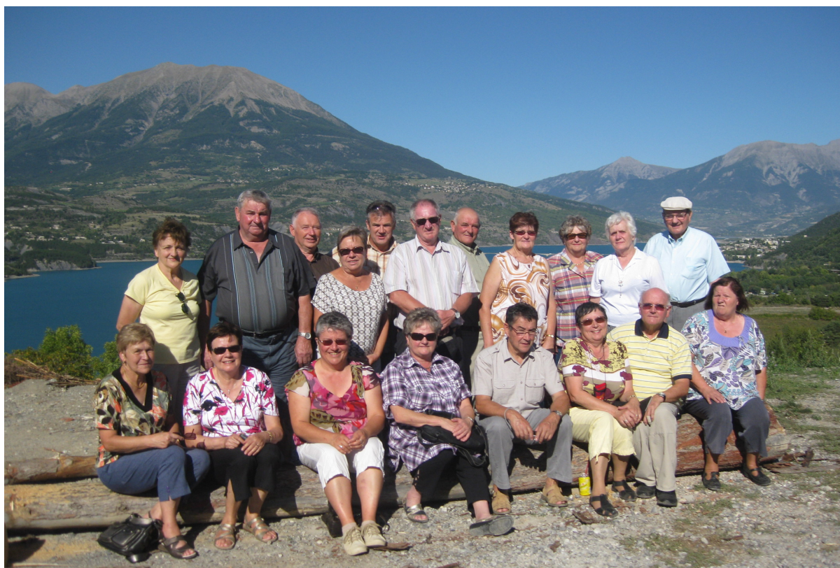
Le groupe avec à l'arrière-plan le lac de Serre-Ponçon

La journée à Cunéo, en Italie. Il a fallu passer le Col de l'Arche (1991m). La traversée des paysages magnifiques est impressionnante et la vue des marmottes se déplaçant non loin de notre passage amusante. La ville de l'autre côté des Alpes est perchée sur la pointe d'un haut plateau entre deux fleuves qui se rejoignent. Nous avons visité le centre avec son vaste marché, ses arcades et sa cathédrale.