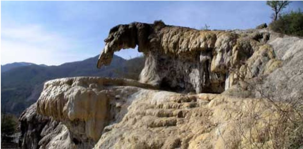
La fontaine pétrifiante de Rotier