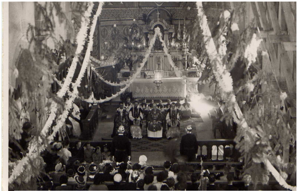
Intérieur de notre église avant restauration

Les enfants scolarisés se devaient d'assister aux messes le dimanche sous peine de punitions. La discipline à surveiller côté garçons fut assurée dans le rôle d'un gendarme par la personne de la gouvernante du curé, se trouvant